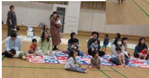
絵本の時間になると、みんな一生懸命見えています。